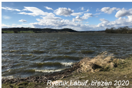
Rybník Labuť, březen 2020

ke Kosatínskému viklanu (5), u něhož byly nalezeny laténské střepy. Dle archeologa Bedřicha Dubského je to důkazem, že kámen byl kultovním místem Keltů, kteří obývali hradiště na nedalekém vrchu Hrad. Od křižovatky pokračujeme 0,5 km na silnici, kde je vlevo studánka (6), z níž vytéká voda do malého rybníčku. Z rybníčku se rozlévá do slatinné louky - pří-