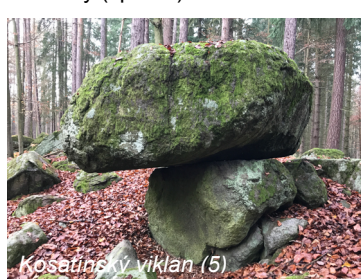
Kosatínský viklan (5)

Po žluté pak pokračujeme dále k samotě U Nováka, odkud pocházela spisovatelka Tereza Nováková. Od Nováků opustíme doleva žlutou značku, načež přijdeme na silnici, kde se setkáváme s cyklostezkou 311. Dále pokračujeme cyklostezkou podél lesa. Cestou mineme 2 rybníky. První (vlevo) má zarostlou hráz, zatímco druhý (vpravo) má na konci hráze zajímavý sloup (10).