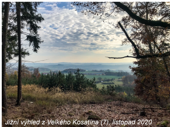
Jihní výhled z Velkého Kosatína (7), listopad 2020