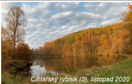
Cihlářský rybník (2), listopad 2020

Ve Výšicích na křižovatce (11) odbočíme mezi domky doprava. Jdeme borovicovou alejí a pak podél lesa. V místě, kde cesta vstupuje do lesa se zastavíme a popojdeme asi 40 m doleva. Jsme u velké jámy - bývalého Lomu na Prašivce (12). Vrátime se na cestu, která nás přivede na červenou značku. Ta nás směrem vlevo dovede do Kožlí. Odtud půjdeme cyklostezkou 311 po silnici k penzionu Drtina (13) a hlavní silnici č. 175 do Myštic.