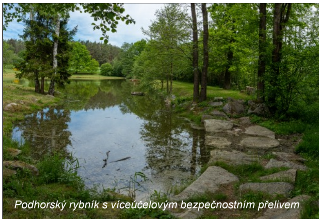
Podhorský rybník s víceúčelovým bezpečnostním přelivem