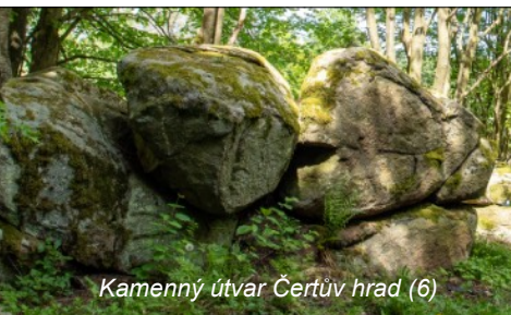
Kamenný útvar Čertův hrad (6)

Za Nezdřevem odbočuje žlutá značka ze silnice doleva a dovede nás po 1,5 km k Čertovu hradu (6). V lokalitě se nacházejí 2 skalní útvary a rybník téhož jména. Dále kaplička se studánkou v podlaze a křížek. Po 50 metrech se znovu setkáváme s modrou naučnou stezkou, s níž opět opustíme žlutou značku. Cesta jde lesem, potom podél lesa. Cestou