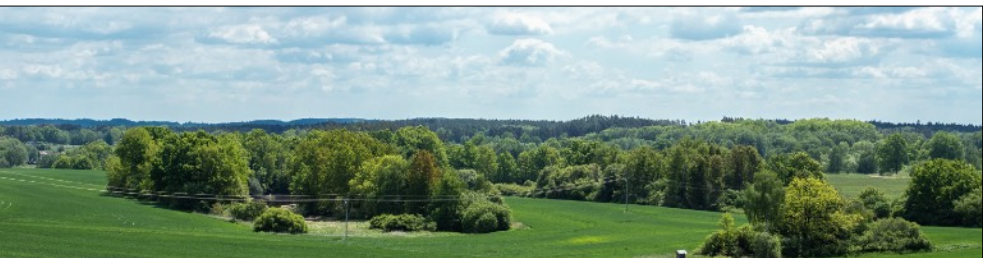
Údolí Hradištského potoka a oba Vidláky od severu, květen 2020

Než překročíme jeho druhý přítok, odbočíme polní cestou doprava. Přijdeme k rybníku Podhorskému (7) a vydechne úžasem: tento rybník je parkově upraven - posezení, ohniště ... Na opačném konci hráze je zajímavý bezpečnostní přeliv, který nemá jen funkci bránit přelítí hráze při velké vodě. Má podobnou